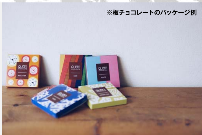
※板チョコレートのパッケージ例