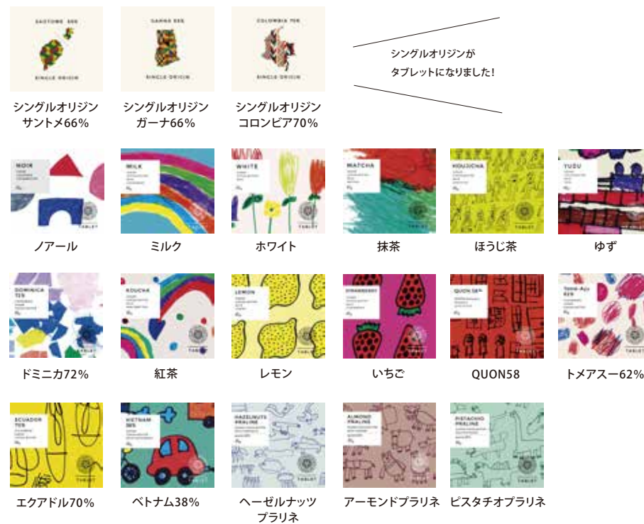
内容：各 1 枚入り (45g)