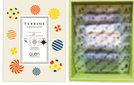
QUONテリーヌ ギフトボックス 内容：6枚入り