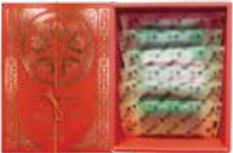
QUONテリーヌ スペシャルアソート 内容：6枚入り