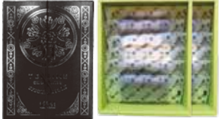
QUONテリーヌ スペシャルアソート 内容：12枚入り