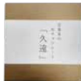
京番茶の生チョコレート 「QUON」

京都の家庭で古くから親しまれている京番茶。お茶の味わいを引き出すため、生クリームは使用せず豆乳で仕上げました。ミルクチョコレートとホワイトチョコレートを独自ブレンドしたチョコレートで仕上げたこだわりの逸品です。宇治の老舗茶舗の京番茶を使用。