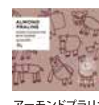
アーモンドプラーレ