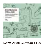
ピスタチオプラーレ