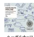
ヘーゼルナッツ プラーレ