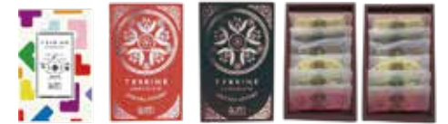
QUON テリーヌギフトボックス / 6枚入り1,380円(税込1,491円) / 12枚入り2,760円(税込2,981円)