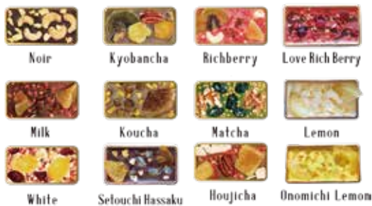
プレミアムテリーヌ / 1枚 380 円 (税込 411 円)

QUONオリジナルチョコレートに色とりどりのドライフルーツやナッツをトッピング。ひとくちごとに新しい美味しさに出会える、見た目も華やかなスペシャルプレートです。