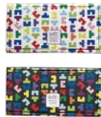
プレミアムテリーヌギフトボックス / 4枚入り 1,500 円税込 1,642 円)